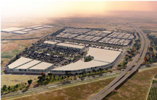
Vista Panorámica desde el Noreste