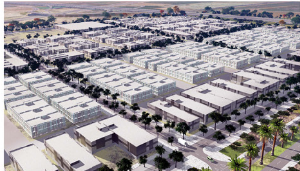
Vista de la Zona de Usos Industriales y sus variables tipológicas