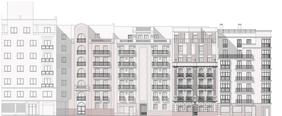
Alzado desarrollado de la calle Antonio Acuña